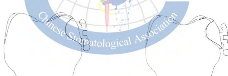
a) 后牙托槽水平槽沟（带状弓系统） b) 前牙托槽水平槽沟（扁状弓系统）