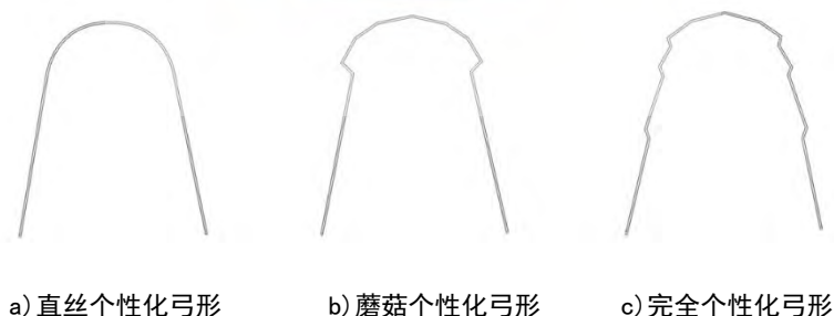
图1 个性化舌侧弓形

舌侧完全个性化弓形是一根顺着牙齿舌面走向的弓形，弓丝的每一段都是“第一序列”弯曲，近乎贴近牙齿舌面走形，距离舌面仅仅只有保留托槽体的距离。这样的弓形具有较薄的托槽体，但是滑动性较差。